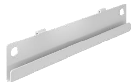
Rail support bacs à bec